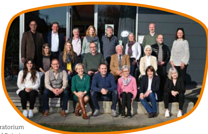
Kuratorium und Beirat